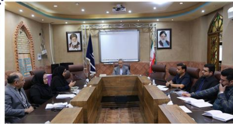
برگزاری کمیته دانشگاهی تعالی خدمات