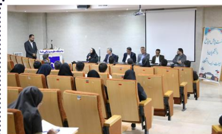
جلسه پرسش و پاسخ دانشجویان با هیئت رئیسه دانشگاه علوم پزشکی فسا برگزار شد