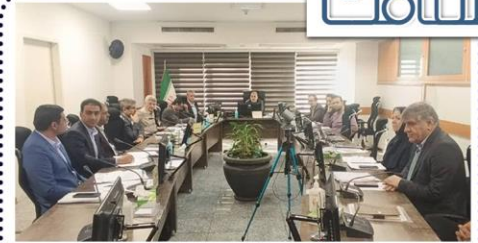
برگزاری نشست هیأت امناء دانشگاه علوم پزشکی فسا با حضور

کمیته دانشگاهی تعالی خدمات اورژانس بیمارستانی دانشگاه علوم پزشکی فسا با حضور دکتر پزشکی رئیس دانشگاه، مدیر درمان، روسا و مدیران بیمارستان‌های تابعه و کارشناسان مرتبط برگزار گردید. این نشست با هدف اجرای سیاست‌های ابلاغی وزارت بهداشت، درمان و آموزش پزشکی و در راستای ارتقای کیفیت خدمات اورژانس تشکیل گردید.