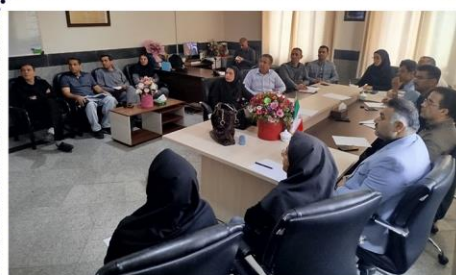
وبینار معاونین بهداشت دانشگاه‌های علوم پزشکی سراسر کشور؛ آمادگی حوزه بهداشت در شرایط اضطراری