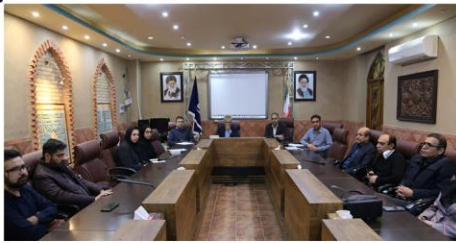
نشست هم‌اندیشی و پرسش و پاسخ

پزشکان متخصص با رئیس و معاونین توسعه و درمان دانشگاه علوم پزشکی فسا برگزار شد